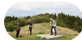
日戸は4年ぶりです！

日時 6/18(木) 9:00~14:30 持物 昼食、飲物、歩くのに適した服装 及び靴、日差し対策(頭・目) 申込 6/9(火)~14(日) 窓口Or電話に2 ※雨天中止 ※申込は下部【問合せ・申込先】へ 右打ちか左打ちかお知らせください 参加料 会員1,200円 非会員2,200円 (当日集金、プレイ費含)