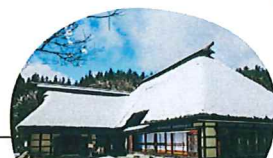
3月に撮影した曲り家 中にも入れます!

スケジュール 7:30 森のアリーナ出発 10:00 桜並木ウォーキング(2km) 11:00 福泉寺(1km) 12:30 遠野ふるさと村(2km) (曲り家で昼食) 17:00 森のアリーナ到着 ※天候等により予定を変更する場合があります。 ※合計5km程歩きます。福泉寺では坂道もあります。 ノルディックポール借用は希望者のみ。